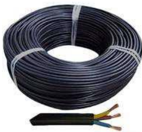
REGLON 55 y 56