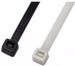
REGLON 39 al 46