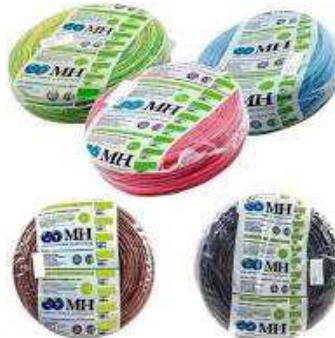
REGLON 47 al 54