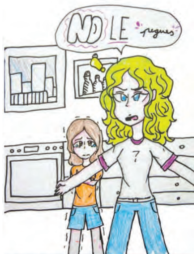
Derecho a un buen trato y a la protección contra la violencia. Censura. 1° año.

Además, desde diferentes organismos se impulsaron acciones de formación en ciudadanía digital orientadas a la prevención del ciberacoso, el ciberbullying y otras formas de violencia en entornos digitales, alcanzando a más de 13.300 chicas y chicos de escuelas primarias y secundarias en 2025.